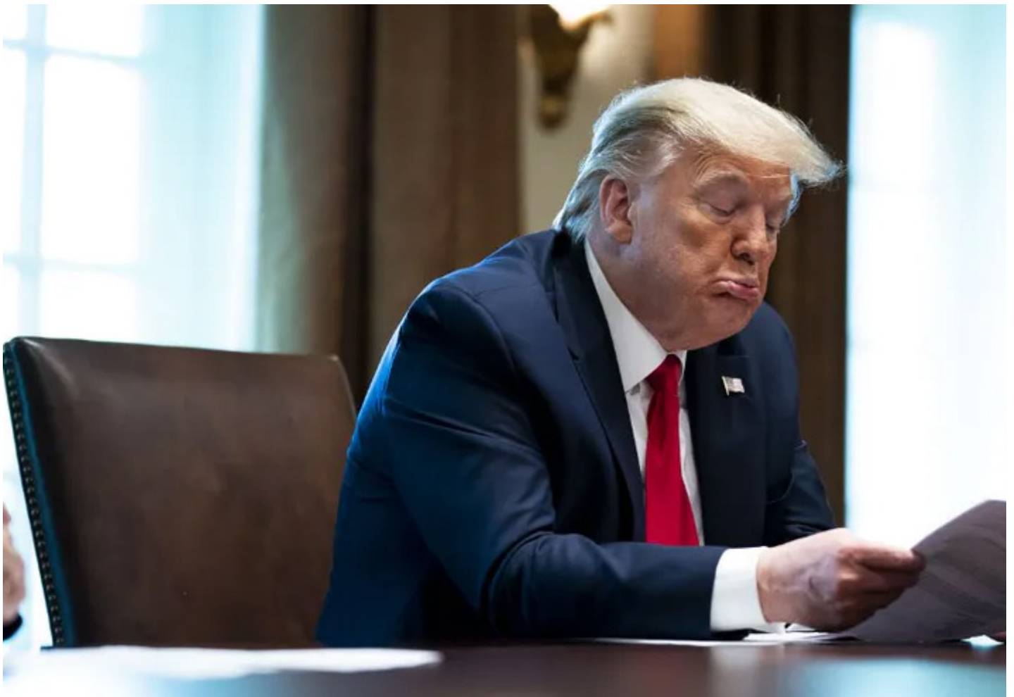
Donald Trump à la Maison blanche

Sous sa devise qui proclame sur fond noir « Democracy dies in darkness », le site Internet du Washington Post présente une carte mondiale de l'épidémie suivie d'un tableau actualisé plusieurs fois par jour du terrible décompte des cas et des décès dus au Covid-19. Le 11 avril 2020, avec un nombre de morts qui dépasse désormais celui de l'Italie, les États-Unis sont passés en première position. Le slogan « America First » résonne alors de façon tragique.